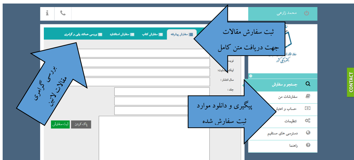
شکل شماره 5. ثبت سفارش متن کامل مقالات

مورد دوم استفاده از پروفایل شخصی آن است که قادر خواهید بود مقالاتی را که امکان دانلود متن کامل آنها از طریق پورتال خدمات آنلاین (که در ادامه بدان اشاره خواهد شد) وجود ندارد ثبت سفارش نموده و در قسمت سفارشات من در پروفایل شخصی خود پیگیری و دانلود فرمایید. همچنین اعضای گرامی می‌توانند مقالات لاتین خود را جهت بررسی گرامری در منوی جستجو و سفارش و Tab بررسی همانند یابی و گرامری وارد نموده و نتیجه را ملاحظه فرمایند (شکل شماره 5).